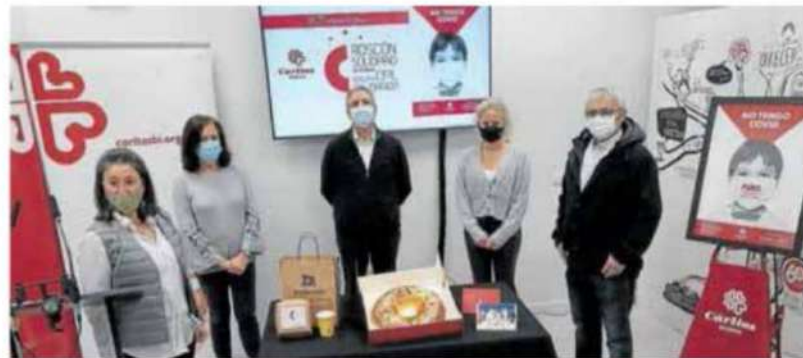
Cáritas Bizkaia acudirá el próximo 5 de enero a su cita anual con el roscón solidario.

Aunque el objetivo se mantiene, la pandemia obligará a cambiar el formato del acto. Se mantendrá la fecha, eso sí, el martes 5 de enero, pero esta vez las personas que quieran hacer